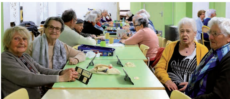
Les adhérents du club « Les fils d'argent » quitteront la maison de la commune pour pique-niquer dans le parc en juillet et en septembre.

Deux sorties « pique-nique » vont être organisées au sein du club « Les fils d'argent ». La première aura lieu le jeudi 27 juillet et la seconde le jeudi 14 septembre. Dans les deux cas, le rendez-vous est donné à l'heure du déjeuner au siège de la pétanque du Pont, au parc municipal.