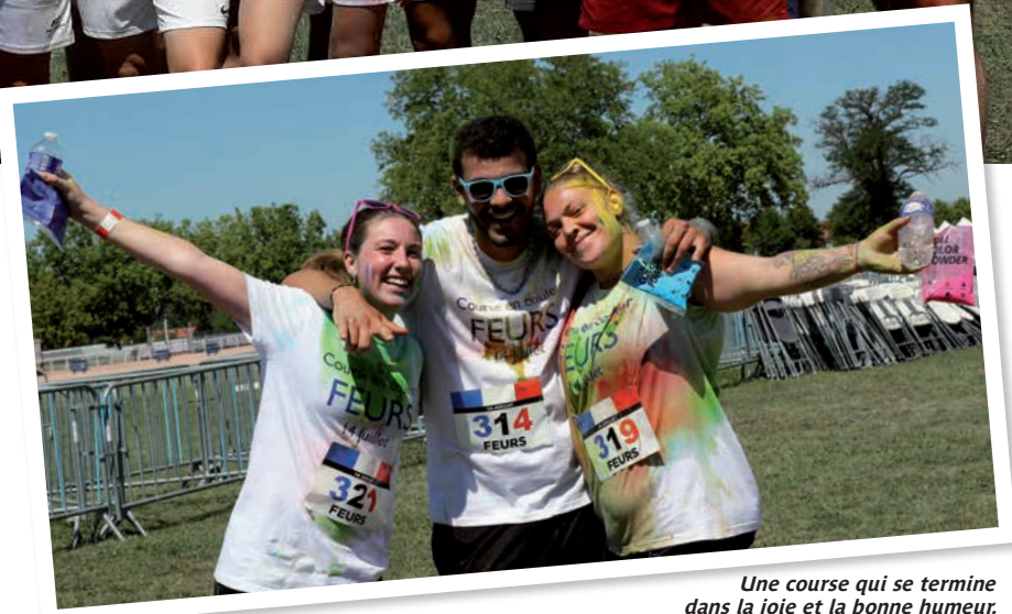
Une course qui se termine dans la joie et la bonne humeur.

Si l'an dernier des participants sont venus déguisés, cette année les cinq meilleurs concurrents costumés seront récompensés. Pour participer, il suffira de se faire prendre en photo avec son dos-