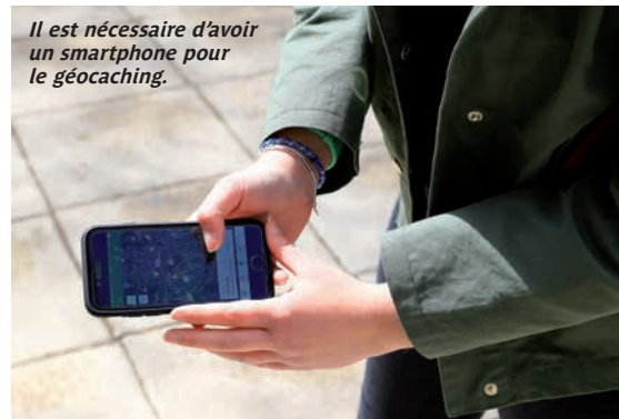
Il est nécessaire d'avoir un smartphone pour le géocaching.

• Vendredi 28 juillet, 9 h 30, bureau d'information touristique place Drivet. Tarifs : adulte : 6 € ; enfant 6-18 ans : 3 € ; gratuit pour les moins de six ans. Réservation obligatoire au 04 77 28 67 70 ou via le site internet www.visites-forez-est.com ; Courriel : visites@forez-est.com