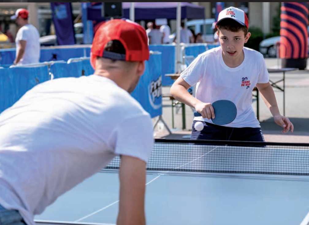
La première étape de la caravane du Ping tour s'est arrêtée à Feurs. Les bénévoles de l'entente Feurs-Civens de tennis de table, avec le concours du service des sports et de « Feurs terre de jeux 2024 » ont mis les petits plats dans les grands pour accueillir cet événement national. Le public, dont de nombreuses familles, sont venues découvrir le ping-pong. Il y avait des jeux virtuels, des jeux accessibles aux personnes handicapées, ... Les photographes du Caméra photo-club s'en sont donnés à cœur joie travaillant la vitesse et utilisant les téléobjectifs.