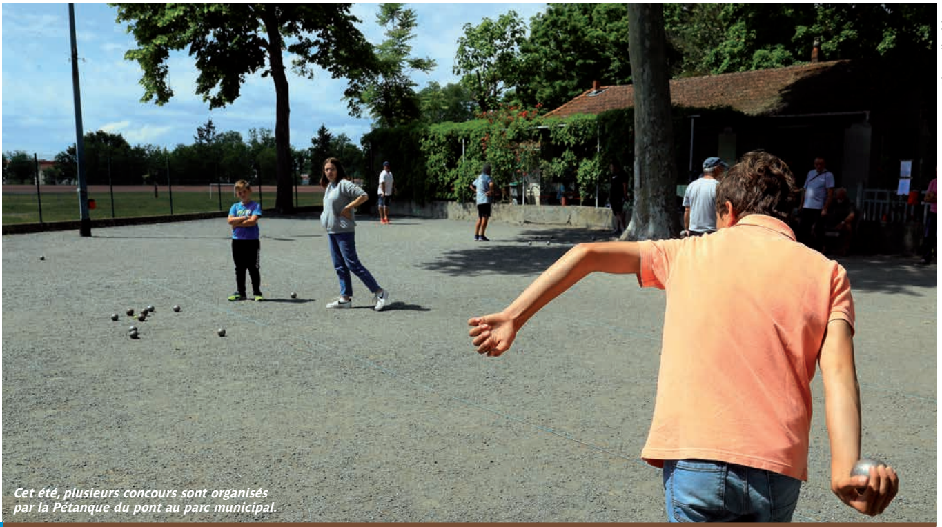
Cet été, plusieurs concours sont organisés par la Pétanque du pont au parc municipal.