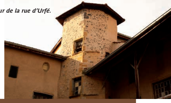
La tour de la rue d'Urfé.