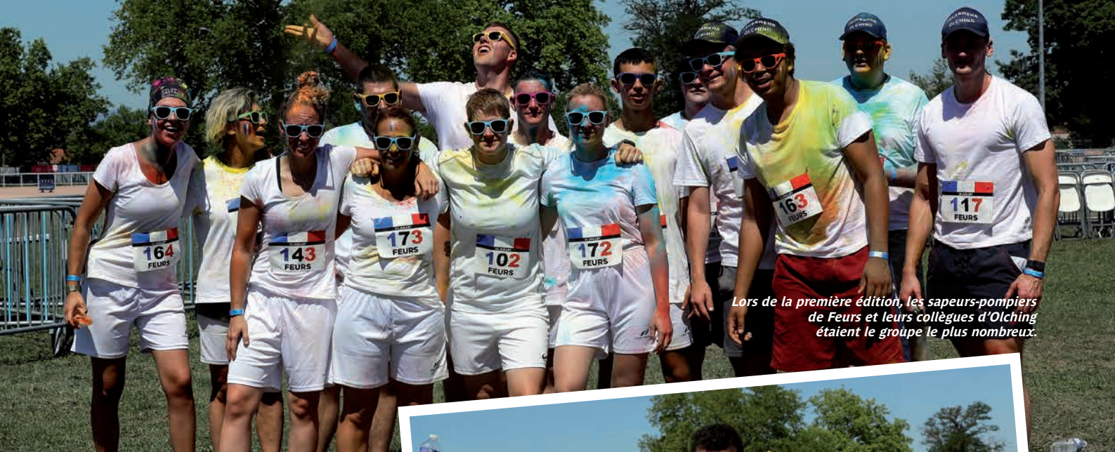
Lors de la première édition, les sapeurs-pompiers de Feurs et leurs collègues d'Olching étaient le groupe le plus nombreux.

La deuxième édition de la course en couleur se déroulera sur l'hippodrome, vendredi 14 juillet à 18 heures.