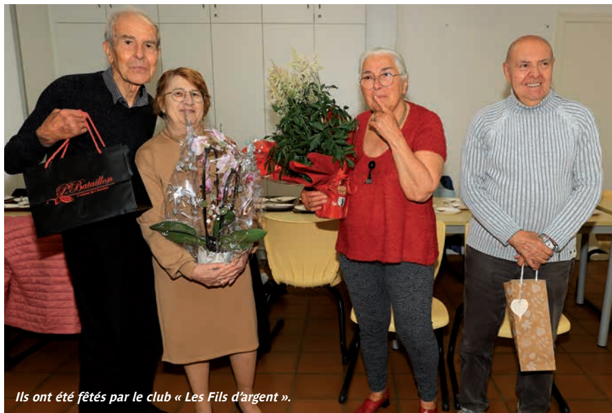
Ils ont été fêtés par le club « Les Fils d'argent ».

Le jeudi c'est le grand jour du club « Les fils d'argent ». Les adhérents (près de 80) se retrouvent avec plaisir à la maison de la commune. Belote, coinche, rami, tarot, scrabble et bien d'autres jeux sont au menu de l'après-midi. C'est aussi l'occasion, avec son voisin de table et autour d'un café, de discuter de l'actualité forézienne.