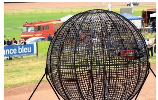
Le globe infernale est une animation très impressionnante surtout avec deux motos à pleine vitesse se croisant à l'intérieur.