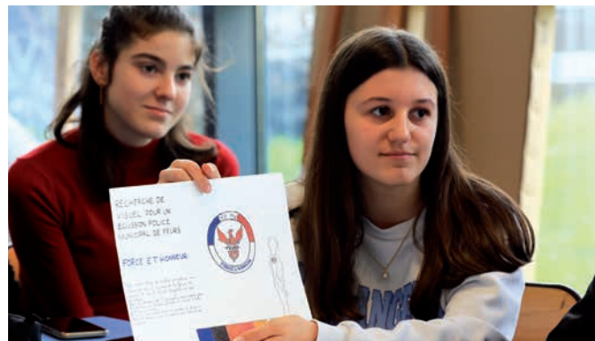
Chaque dessin a été présenté et commenté par les élèves de seconde option « arts plastiques » du lycée du Forez.