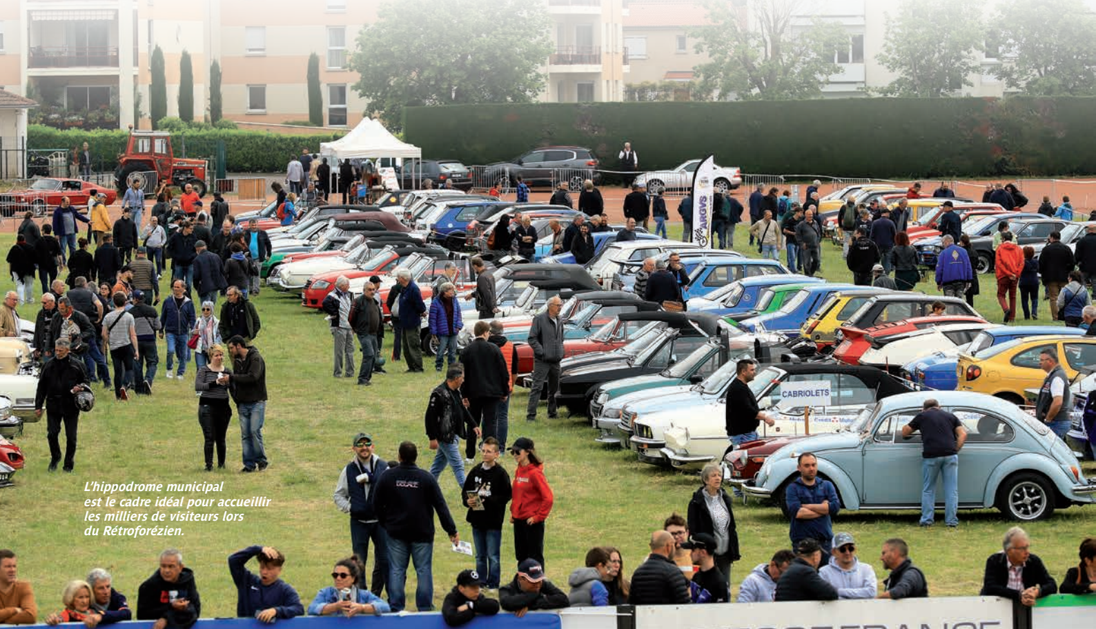
L'hippodrome municipal est le cadre idéal pour accueillir les milliers de visiteurs lors du Rétroforézien.

Avec près de 5 000 visiteurs et 800 voitures exposées, le 18 e Rétroforézien confirme être une manifestation phare de Feurs.