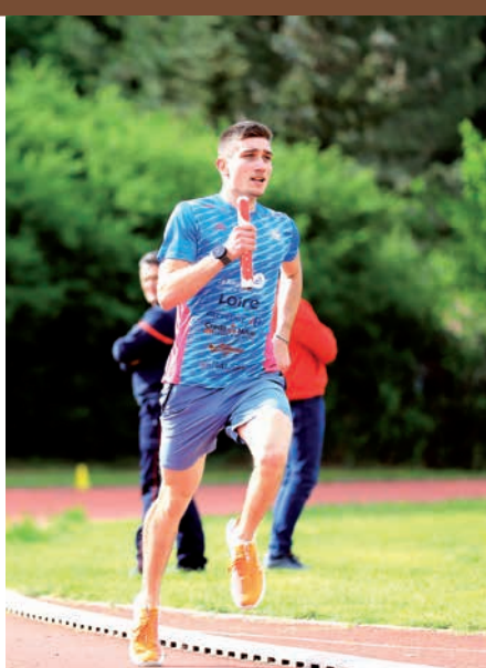
Les sapeurs-pompiers de la caserne de Feurs ont notamment participé au relais 4 x 400 mètres...