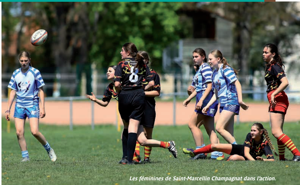
Les féminines de Saint-Marcellin Champagnat dans l'action.