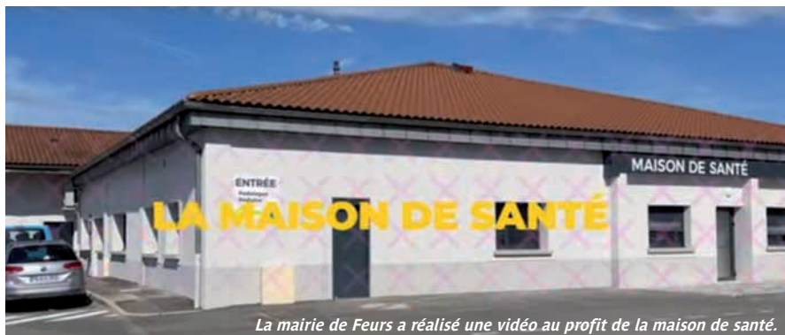
La mairie de Feurs a réalisé une vidéo au profit de la maison de santé.

Elle l'a fait en faisant réaliser par ses services une vidéo de plus de deux minutes pour présenter la maison de santé. Les docteurs Pauline Bailly et Nicolas Costa décrivent très clairement les atouts de ce lieu pluridisciplinaire. Cette vidéo a dépassé les 25 000 vues sur les réseaux sociaux et partagé plus de 520 fois.