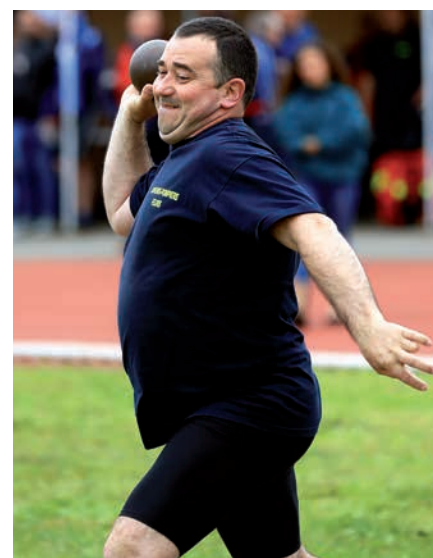
...et au lancement du poids.