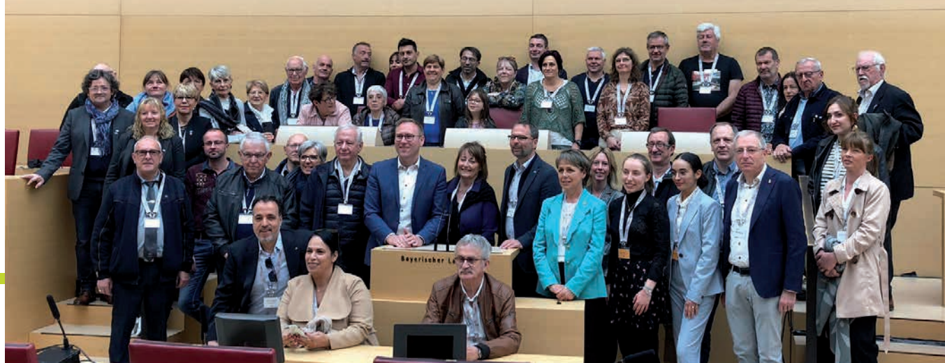
La délégation forézienne a visité le landtag de Bavière, à Munich.

Mme le maire de Feurs devait ensuite remettre un présent qui, à lui seul, porte toute la symbolique de ce moment.